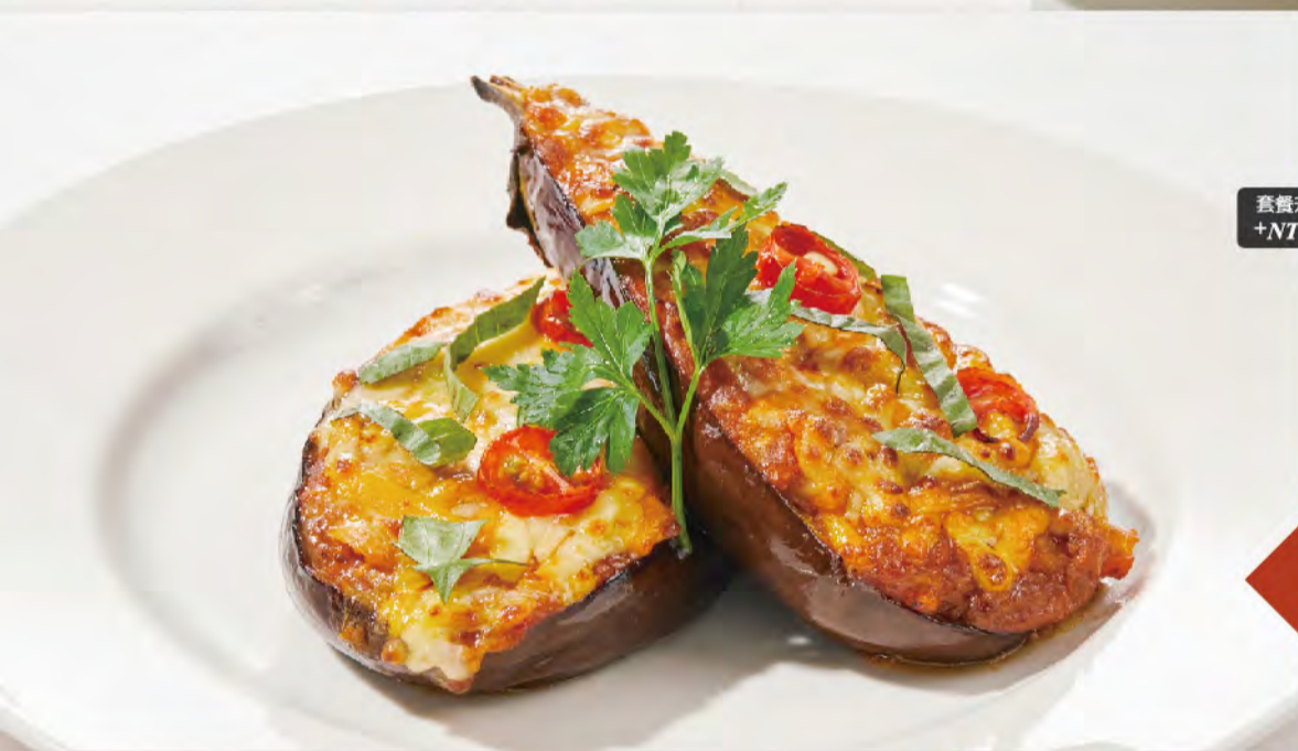
*NEW 套餐升級 +NT$30 義式焗烤起士肉醬圓茄 香軟烤茄遇見起士肉醬 Eggplant Bolognese Cheese Gratin NT$180

牛肝菌奶油濃湯、玉米濃湯、 匈牙利牛肉湯、義式蔬菜湯、 南瓜濃湯選項另有四人份大湯 供單點或四人餐選擇, 每份300元。