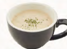
♥ 牛肝菌奶油濃湯 Creamy Porcini Soup 融入義大利高級蘑菇滑順可口