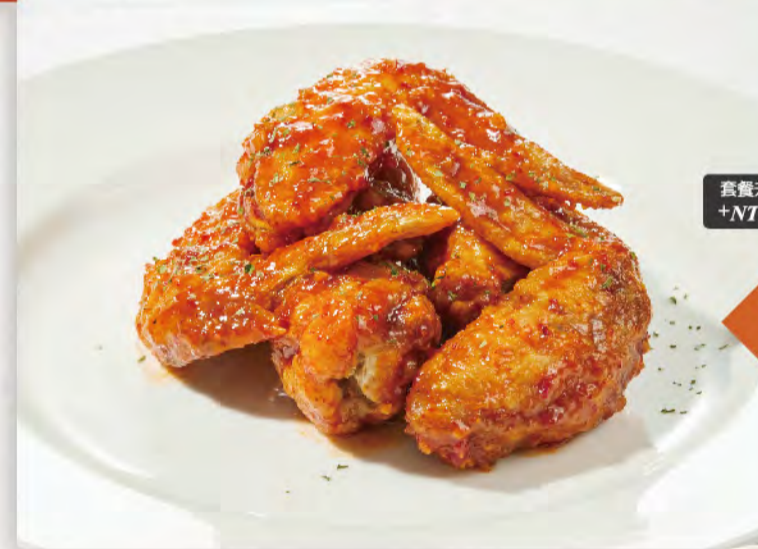
*NEW 套餐升級 +NT$30 洋釀炸雞翅 酥脆的炸雞翻裹上香甜微辣 的醬汁, 好吃不膩口! NeNe Chicken NT$180