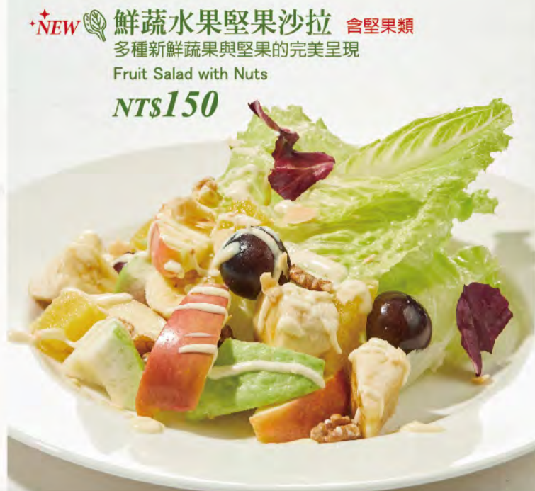
*NEW 鮮蔬水果堅果沙拉 含堅果類 多種新鮮蔬果與堅果的完美呈現 Fruit Salad with Nuts NT$150