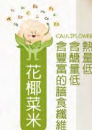
🌸 花椰菜米 熱量低 含膽固醇低 含豐富的膳食纖維 ♥ 花椰菜米起士焗烤鮭魚盅 加入花椰菜米, 鮭魚盅營養健康升級 Salmon Cauliflower Rice Gratin NT$150