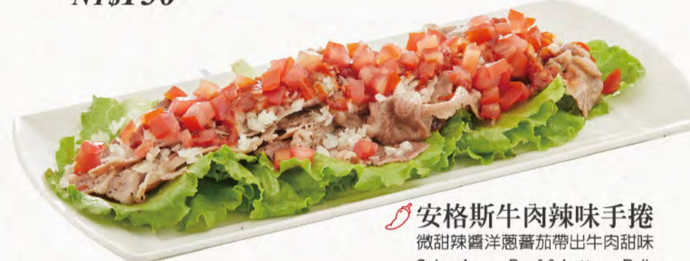
🌶️ 安格斯牛肉辣味手捲 微甜辣醬洋蔥蕃茄帶出牛肉甜味 Spicy Angus Beef & Lettuce Roll NT$150