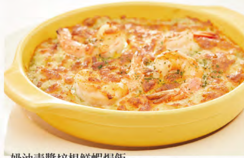
奶油青醬培根鮮蝦焗飯 培根香、海鮮甜、起士濃郁，您的最佳選擇 Shrimp and Bacon Creamy Genovese Doria NT$270