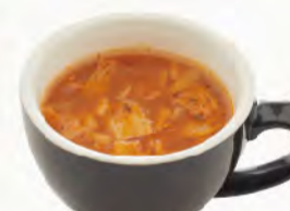
🌿 義式蔬菜湯 Minestrone 蕃茄、蔬菜、義式香料, 清甜潤喉