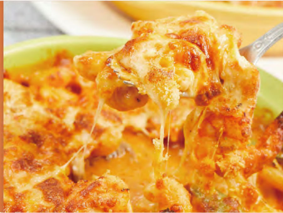
波隆納肉醬牛肉焗彎管麵 傳統義式料理，肉醬、蕃茄為主風味， 襯托出醬汁本身的醇厚滋味 (肉醬為牛豬混合) Bolognese Style Meat Sauce and Beef Macaroni Gratin NT$280