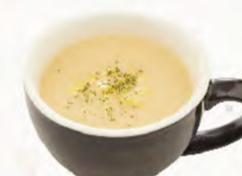
🌿 玉米濃湯 Corn potage 香濃順口, 經典好味道