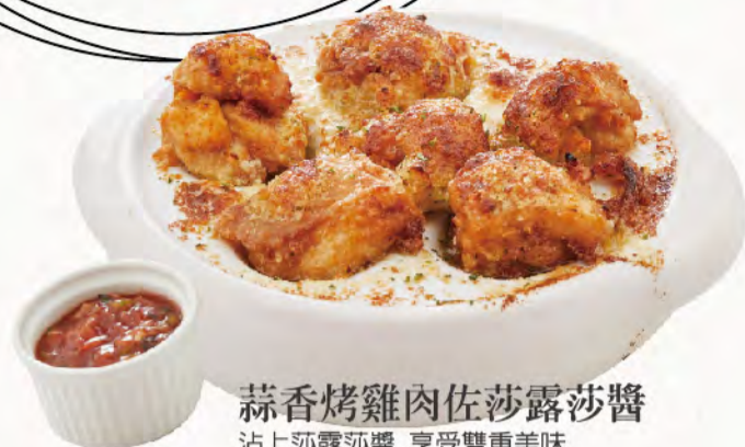
蒜香烤雞肉佐莎露莎醬 沾上莎露莎醬, 享受雙重美味 Garlic Chicken with Salsa NT$150