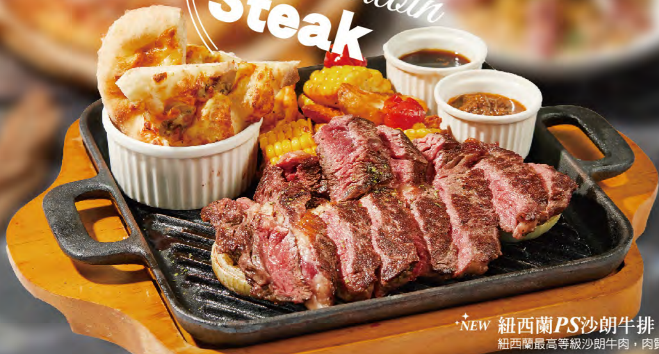
★NEW 紐西蘭PS沙朗牛排 紐西蘭最高等級沙朗牛肉，肉質柔嫩鮮甜多汁 NT$680