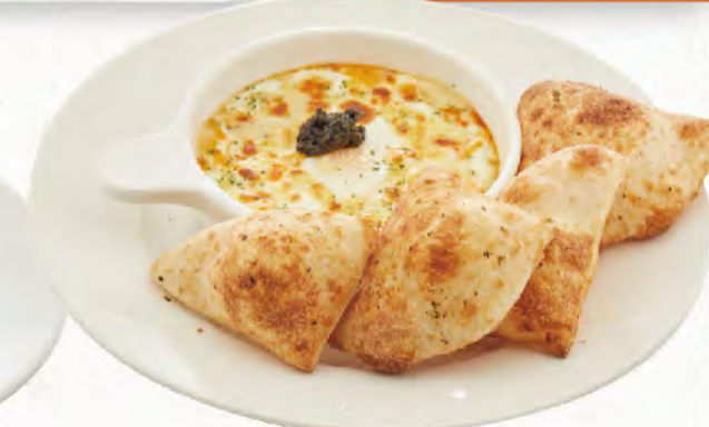
松露馬鈴薯烤蛋佐佛卡夏 松露風味柔順馬鈴薯醬, 驚豔展露無疑 (內含培根) Truffle & Potato Frittata with Focaccia NT$150

歡迎索取辣油 / 起士粉 / 研磨胡椒 / 橄欖油 / Tabasco We provide optional dressing. Please let us know if you're interested. Chili Oil, Powdered Cheese, Pepper, Olive Oil, Tabasco