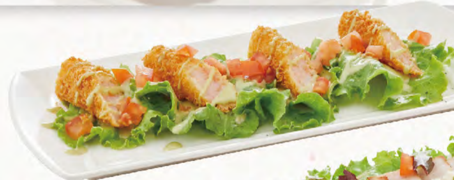
一口蝦棒沙拉 含94%蝦肉, 搭配綠芥末醬, 口口蝦香口口滿足 Fried Shrimp Salad NT$150