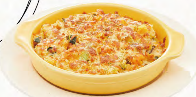
南瓜野菇焗飯 健康美味南瓜、活力來源 Kabocha Squash Doria (vegetable) NT$230