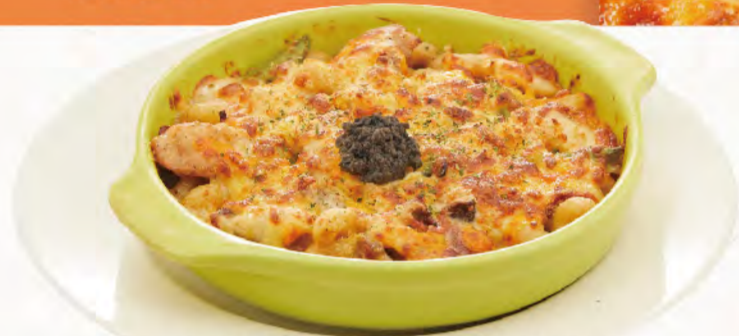
松露風雞腿肉野菇焗彎管麵 爽口雞腿肉、美味野菇為您呈現 Macaroni Gratin with Truffle Chicken Thigh and Mushroom NT$250