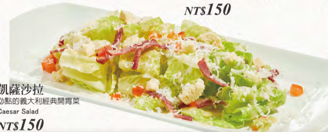
凱薩沙拉 必點的義大利經典開胃菜 Caesar Salad NT$150