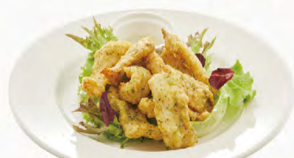
香酥蘿勒鮮魚佐綠芥末醬 香酥炸鮮魚 Crispy Fried Fish Fingers with Wasabi Sauce NT$150