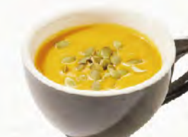
*NEW 南瓜濃湯 含堅果類 Pumpkin Potage 濃郁純厚的南瓜鮮甜

牛肝菌奶油濃湯、玉米濃湯、 匈牙利牛肉湯、義式蔬菜湯、 南瓜濃湯選項另有四人份大湯 供單點或四人餐選擇, 每份300元。