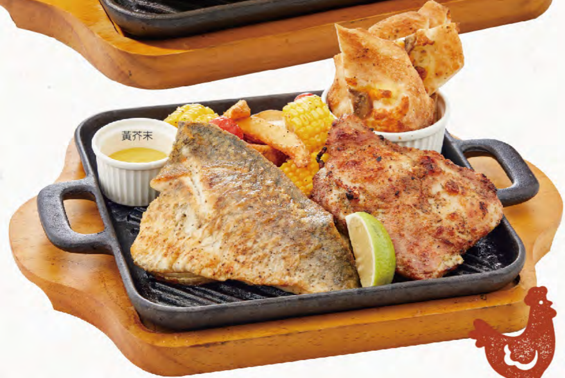
香煎鱸魚排 & 義式香草舒康雞腿排雙拼 香煎鱸魚，義式香草雞腿，時令蔬菜， 美食饗宴為您登場 Sautéed Fish Fillet & Grilled Chicken Thigh with Herbs NT$600

舒康雞脂肪含量低 口感清爽不油膩 胺基酸含量高、保水度高 味道鮮甜多汁、無腥味 是最好的蛋白質來源