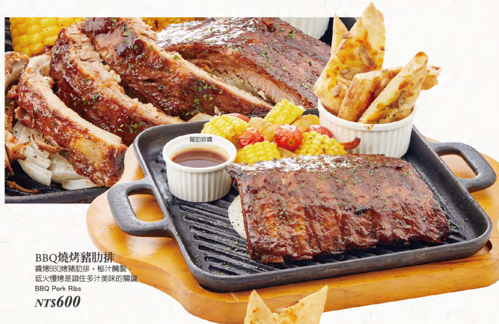
BBQ燒烤豬肋排 醬烤BBQ烤豬肋排，秘汁醃製， 低火慢烤是鎖住多汁美味的關鍵 BBQ Pork Ribs NT$600