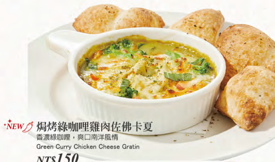
*NEW 焗烤綠咖哩雞肉佐佛卡夏 香濃綠咖哩, 爽口南洋風情 Green Curry Chicken Cheese Gratin NT$150