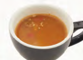
匈牙利牛肉湯 Goulash 蔬菜的香甜與牛肉的精華