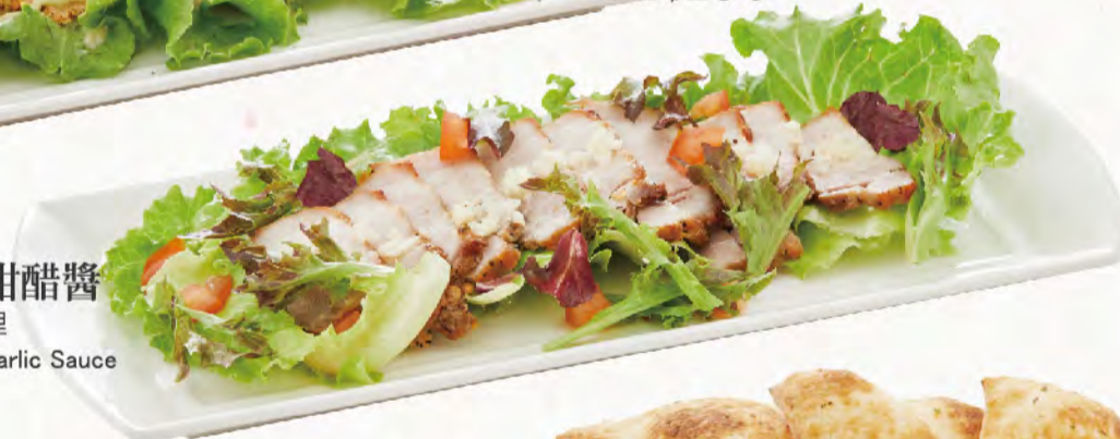
烤醃燻究好豬佐蒜味甜醋醬 台灣在地好豬肉, 演繹義大利料理 Roast Pork with Sweet and Sour Garlic Sauce NT$150