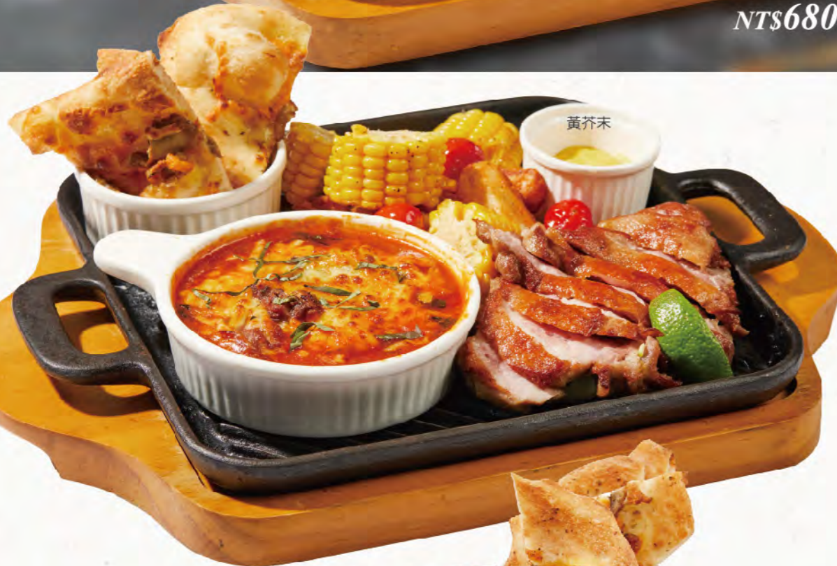
香烤櫻桃鴨腿排 & 焗烤蕃茄燉豬肉 Q彈美味的鴨腿肉 慢火燉煮軟嫩不爛的豬臉頰肉 Cerry Duck Leg & Pork Cheeks in Tomato Cheese Gratin NT$600